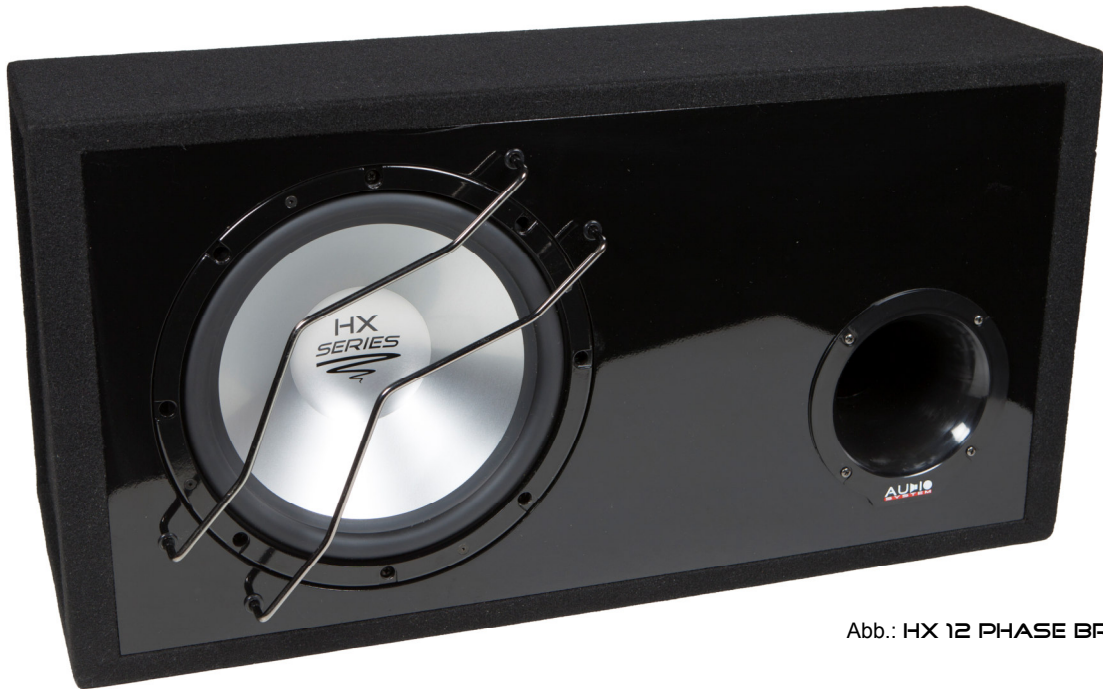
Abb.: HX 12 PHASE BR