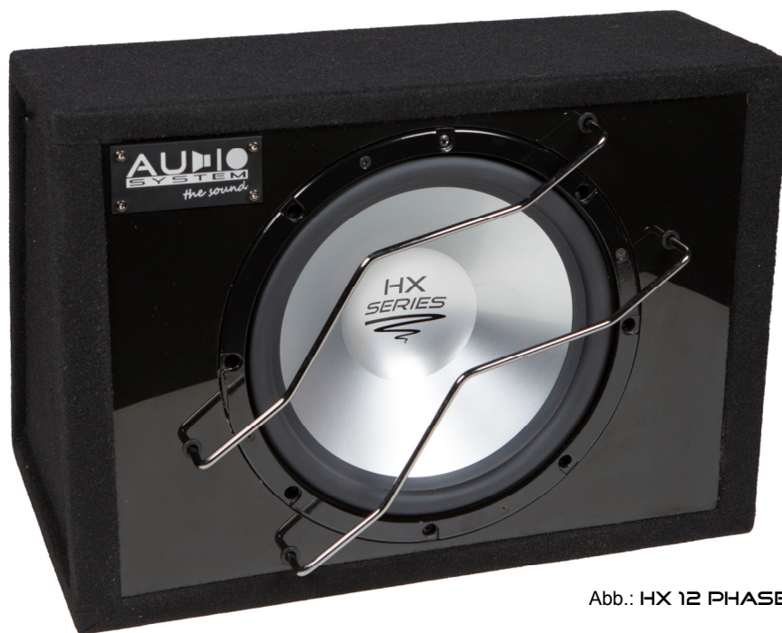
Abb.: HX 12 PHASE G