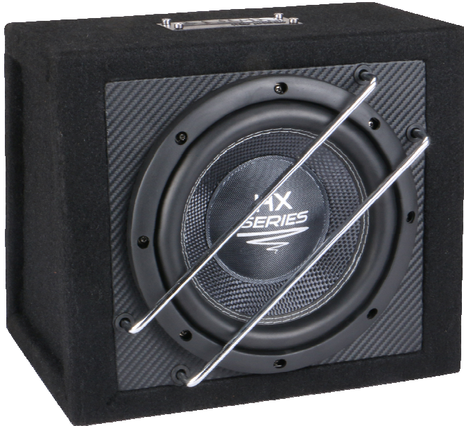
Abb.: HX 08 SQ G