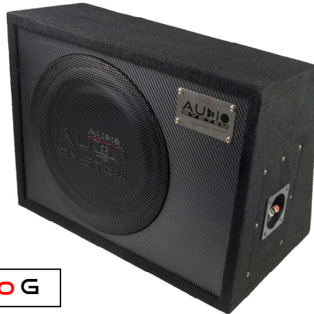
R10 FLAT EVO G