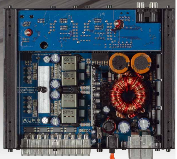
Klare Aufteilung: rechts die Spannungsversorgung, links die Verstärkung der vier Kanäle

Mit nominal 4 x 80 Watt gehört die neue X-80.4 D zwar nicht zu den absoluten Leistungsmonstern, dafür ist sie schön kompakt geworden. Zwar nicht so winzig wie manche Mikroendstufen, aber deutlich kleiner als eine Class-A/B mit vergleichbarer Leistung. Natürlich hätte sie vom Layout noch kleiner werden können, doch auch Digitalverstärker produ-