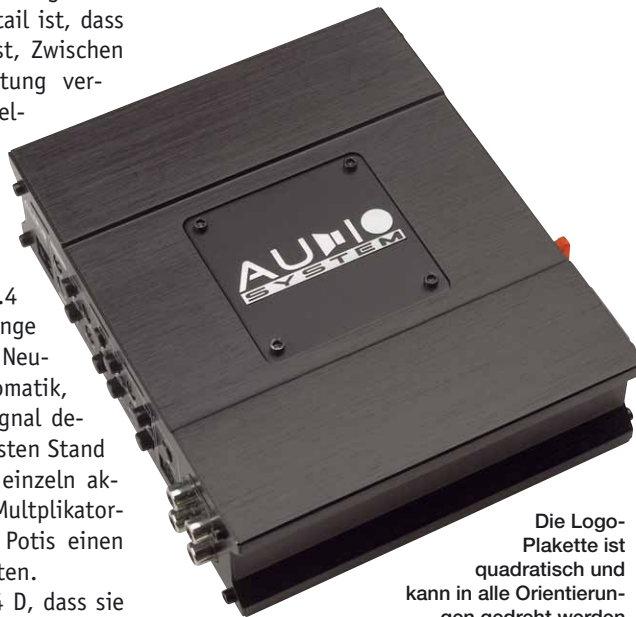
Die Logo-Plakette ist quadratisch und kann in alle Orientierungen gedreht werden