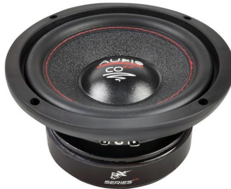
CO 06 QC EVO