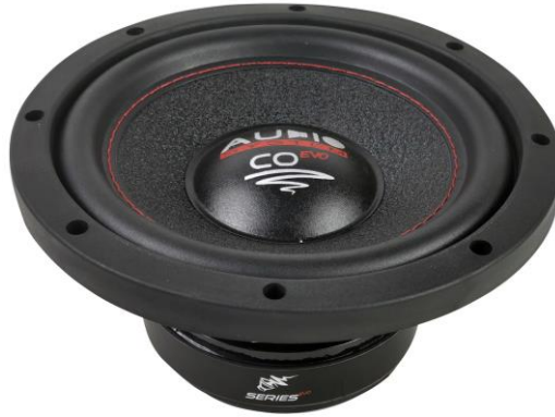
CO 08 QC EVO