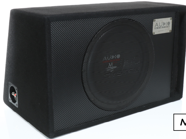
M12 EVO 2 BR